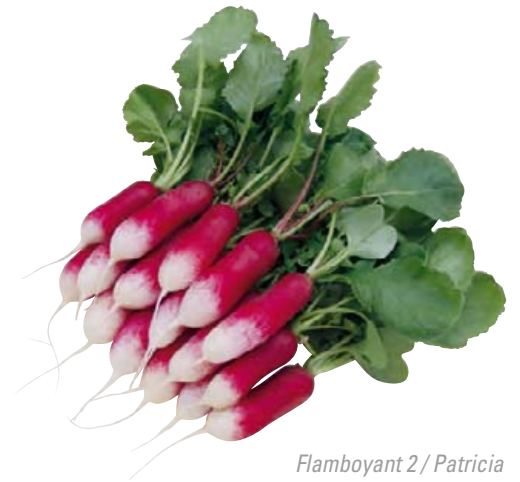
Flamboyant 2 / Patricia

Mittellanges, uniformes, zylindrisches, leuchtend rotes Radies mit weißer Spitze. Exzellente innere Qualität. Mittellanges, kräftiges Laub, sehr gut bündelfähig.