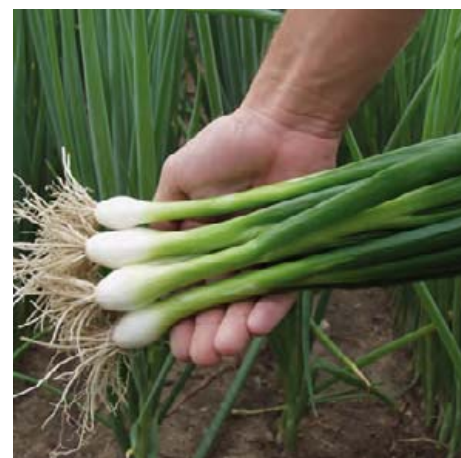
Hi 08 527 ZW