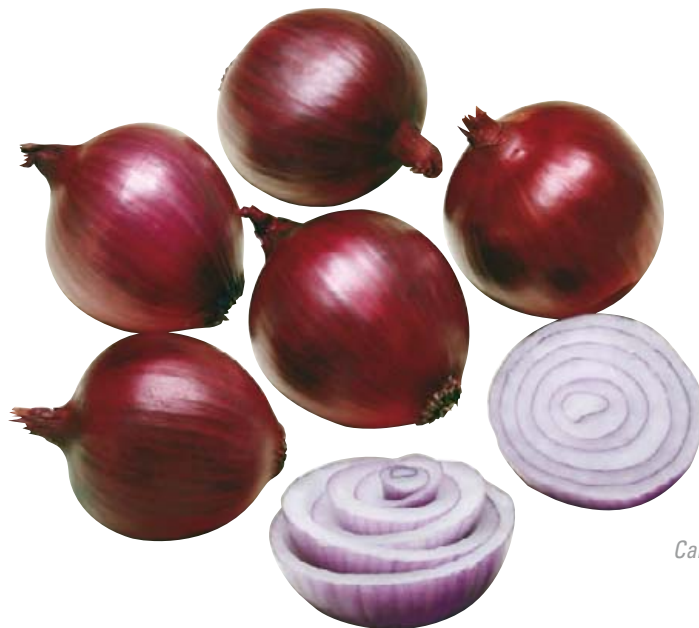
Campillo, F 1

Dunkelrote, runde bis flachrunde Zwiebel mit guter Schalenfestigkeit.